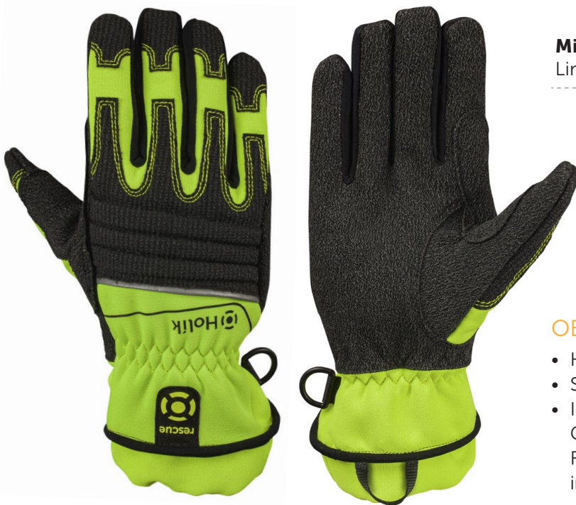
Miwa 6507 Lime green

Für den Schutz der Hände von Rettungskräften und Feuerwehrleuten bei technischen Hilfeleistungen und in vielen anderen Einsatzszenarien. Keine störenden Nähte in der Innenhand.