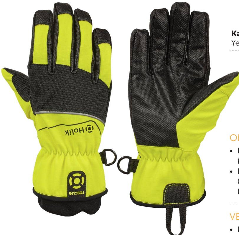
Kashi 8275 Yellow

Textilhandschuhe für technische Einsätze – mit bester Sichtbarkeit, hohem Tastgefühl und Schutz vor mechanischen Risiken auf dem Handrücken.