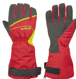
Maris Long Red