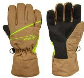
Maris Easy Beige