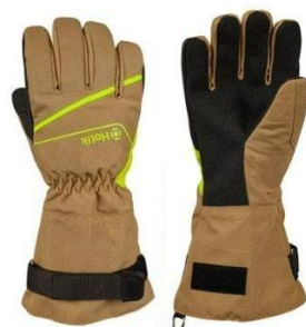
MARIS LONG Beige