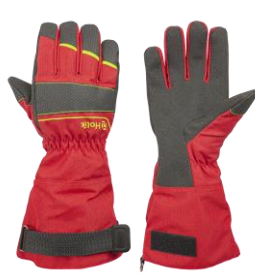
Diamond Long Red