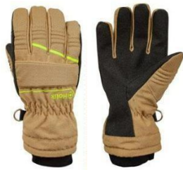
Crystal Evo Beige