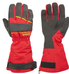
Crystal Long Red