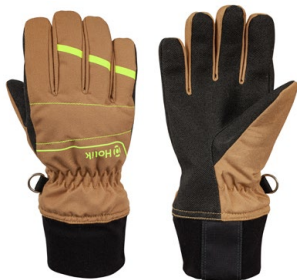
Brella Flexi Beige