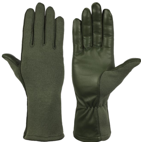
Tracy Sage Green