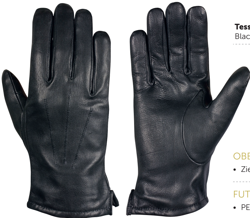
Tessa 8435 Black

Handschuhe, die während des normalen Geschäftsbetriebs oder Uniformen bei feierlichen Anlässen getragen werden sollen