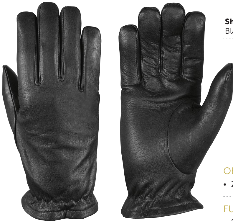
Sheila 8433 Black

Lederhandschuhe mit Schnittschutzfutter, die die ganze Hand vor mechanischen Risiken im täglichen Einsatz bei Polizei- und Sicherheitskräften schützen.