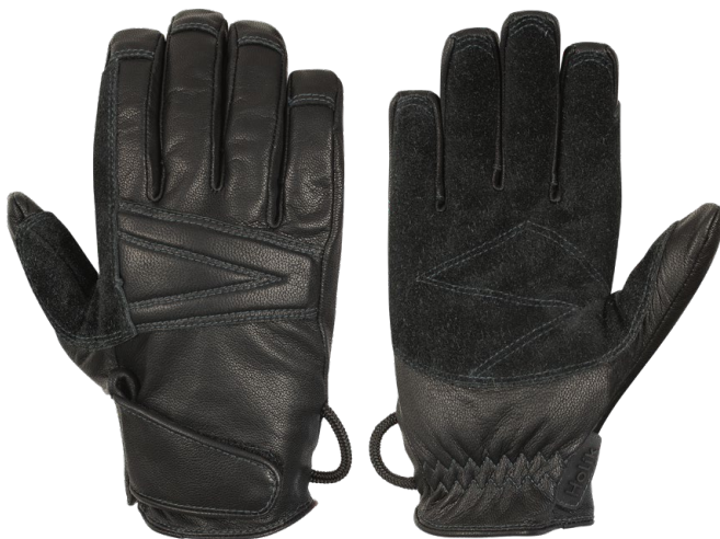
Rency Fast Rope