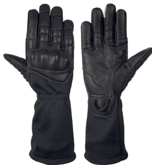
DALIE Black Long