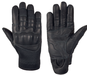
DALIE Black Quick