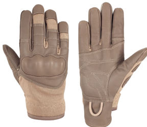
DALIE Coyote Quick