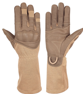
DALIE Coyote Long