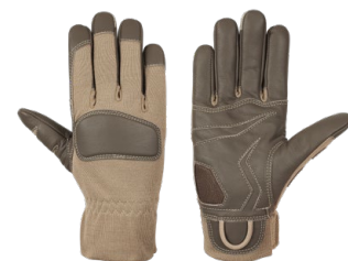
ANIKA Coyote Quick