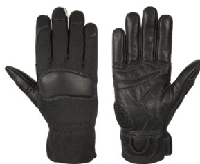
ANIKA Black Quick