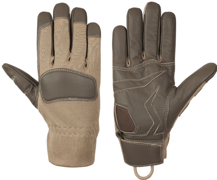
ANIKA Coyote Short

Leichter taktischer Handschuh für alle Militär- und Polizeieinheiten, der den hohen Anforderungen an die Taktilität im täglichen Einsatz gerecht wird, verbunden mit extremer Widerstandsfähigkeit gegen mechanische Risiken.