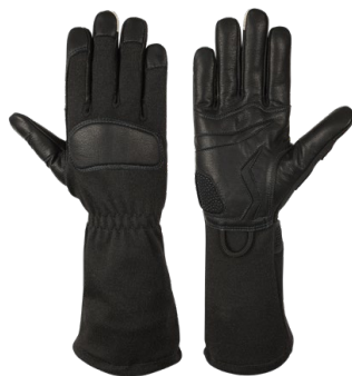
ANIKA Black Long