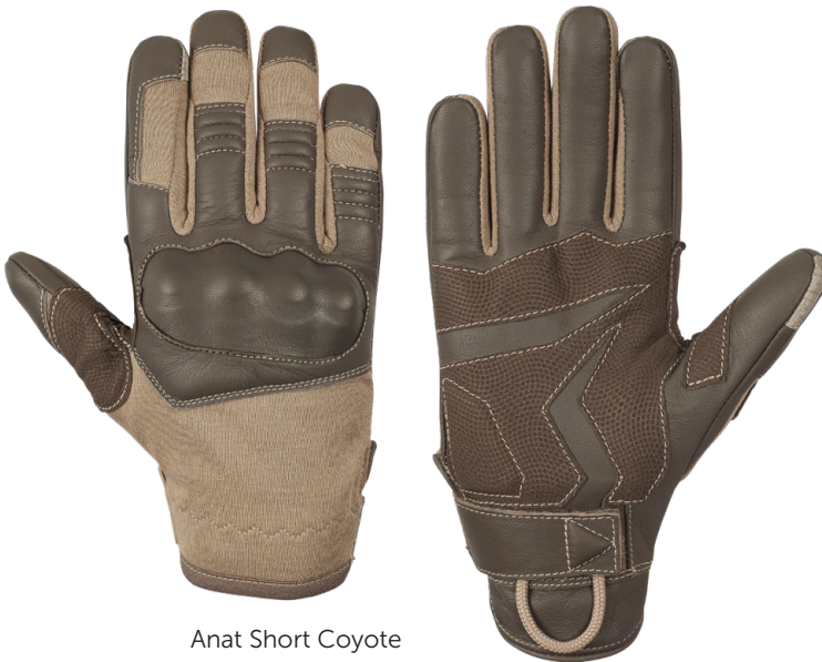
Anat Short Coyote

Taktischer Handschuh mit außergewöhnlich anatomisch bequemem Schnitt, der gleichzeitig hohe Anforderungen an die Widerstandsfähigkeit gegen mechanische Risiken erfüllt.