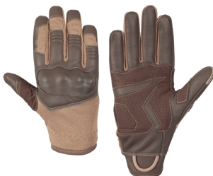
Anat Quick Coyote