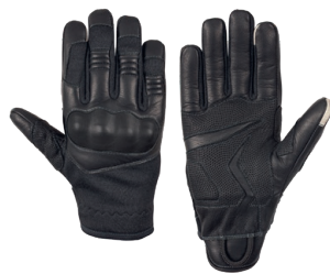
Anat Quick Black