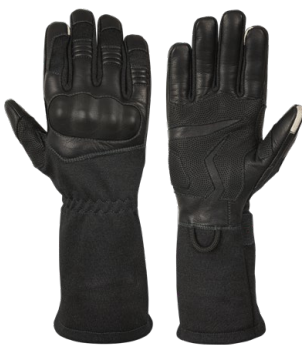
Anat Long Black